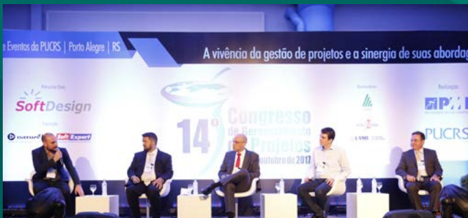
Panel PMO Instituições Financeiras