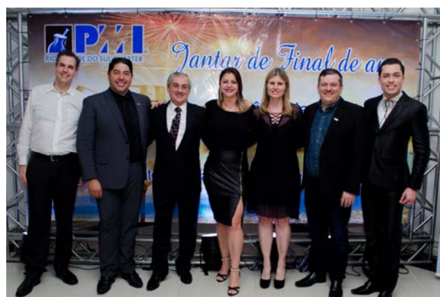
Vps e Presidente