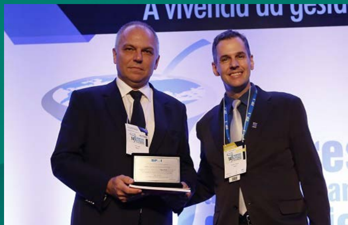
Premiação Projeto do Ano para Lamb Engenharia