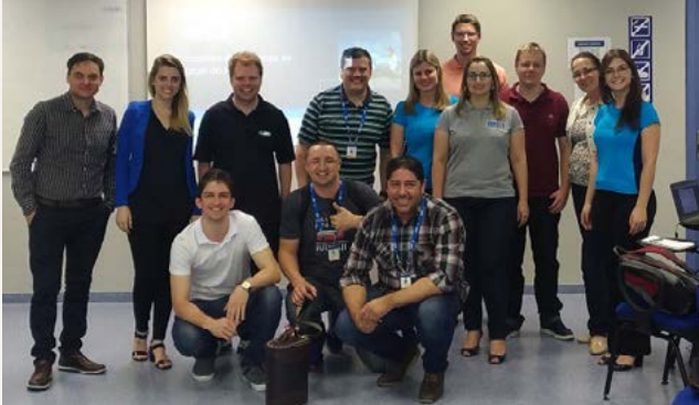
2º Encontro de Branches