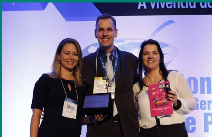
Premiação Projeto do Ano para Sicredi