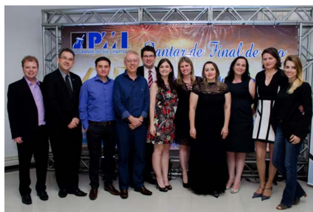
Representantes dos Branches, VP recebeu o prêmio de Destaque