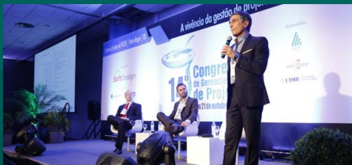
Panel PMO Grenal