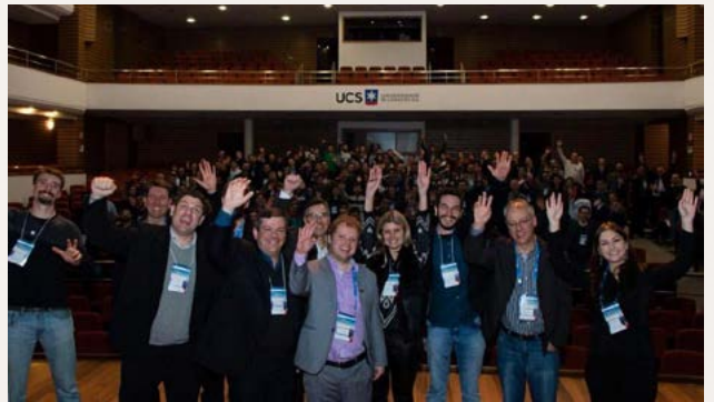
Voluntários do Seminário da Serra