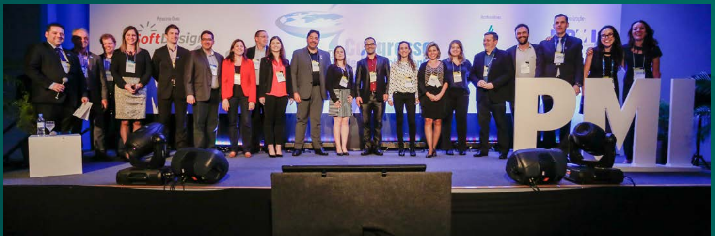
Voluntários do 14º Congresso