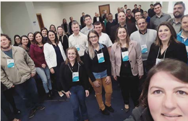
Voluntários do novo Branch Norte