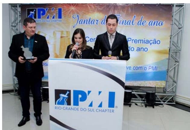
Presidente com Apresentadores, Diretora e VP de Voluntariado