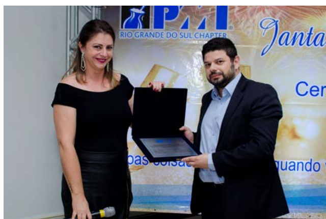
Homenagem Conselho Fiscal