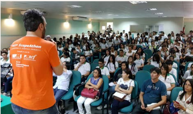
Palestra no PMI Ceará